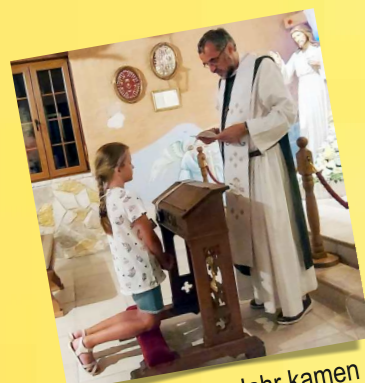
Auch im letzten Jahr kamen immer wieder Pilger, sich das Skapulier auflegen zu lassen.

Pilger aus den folgenden Ländern besuchten die Kapelle im vergangenen Jahr: Paraguay, Philippinen, Indien, Slowakei, Kroatien, Bosnien und Herzegowina, Österreich, Deutschland, Schweiz, Ukraine, Polen, Russland, Irland, USA und Belgien.