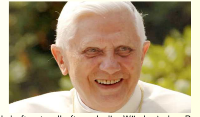
Wahrhaft, standhaft und die Würde jeder Person heilig haltend ist Papst Benedikt XVI. uns ein Vorbild

Stolz und Egoismus, welcher sie selber in eine Opferrolle drängt und zerdrückt. Wenn die innere Bekehrung ausbleibt, wie bei Judas, vollzieht sich zudem immer mehr eine schlechende Vereinigung mit dem Bösen. Der Sieger des inneren Kampfes dringt immer irgendwann und wo nach außen.