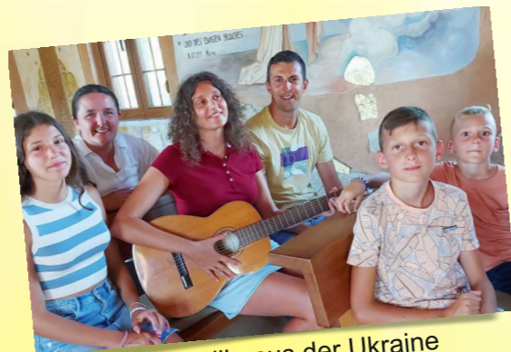
Familie aus der Ukraine

Pilger aus den folgenden Ländern besuchten die Kapelle im vergangenen Jahr: Paraguay, Philippinen, Indien, Slowakei, Kroatien, Bosnien und Herzegowina, Österreich, Deutschland, Schweiz, Ukraine, Polen, Russland, Irland, USA und Belgien.